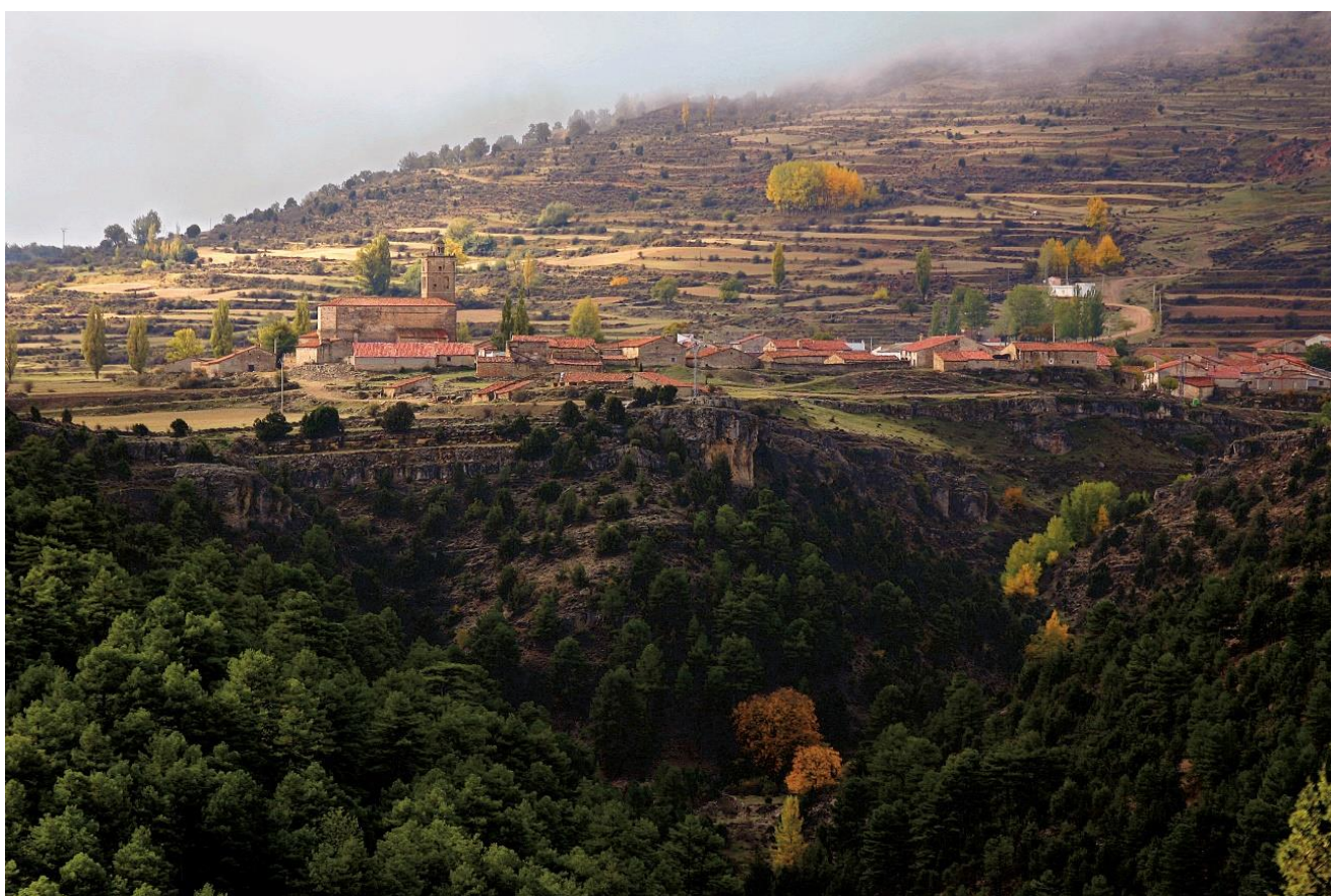
(Fig. 1) Vista panorámica de Jabaloyas

La emigración de sus vecinos, ha sido una constante desde comienzos del siglo XX. Dentro del fenómeno migratorio español, la salida de tantas personas de nuestro pueblo hacia Norteamérica y México, despierta nuestra curiosidad e interés, máxime cuando los protagonistas fueron nuestros abuelos, tíos y padres.