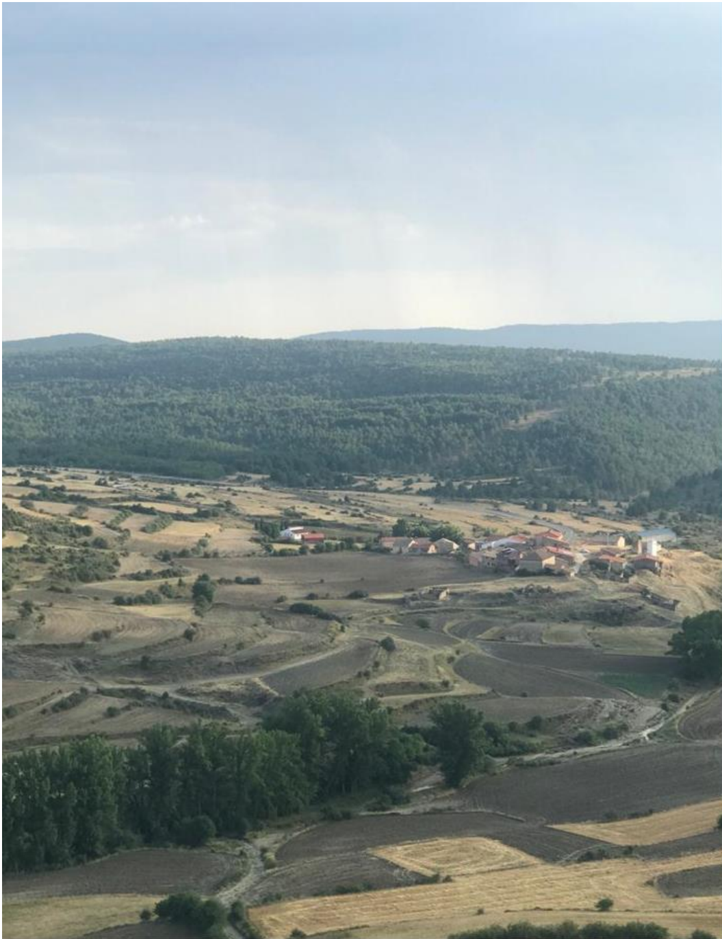
(Fig. 2) Vista panorámica de Arroyofrío